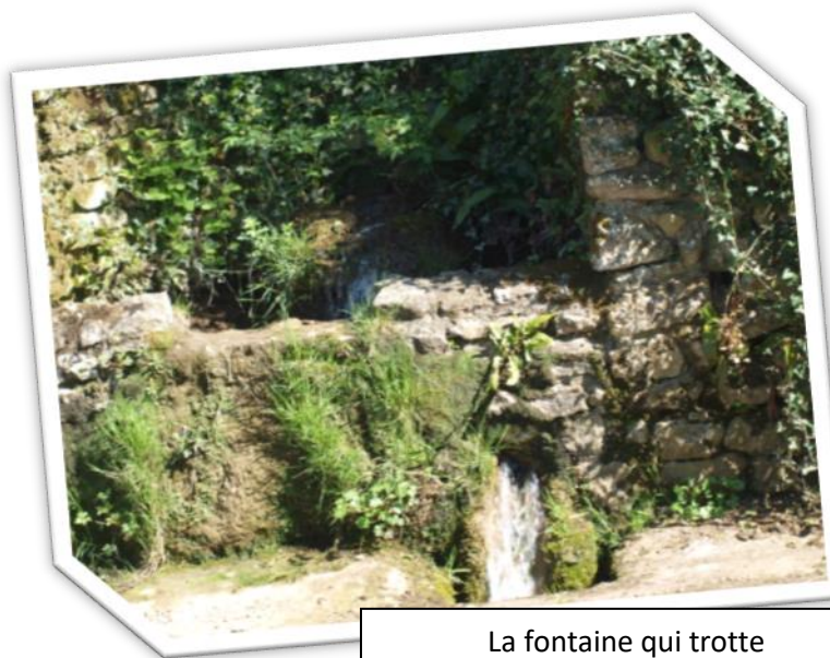
La fontaine qui trotte