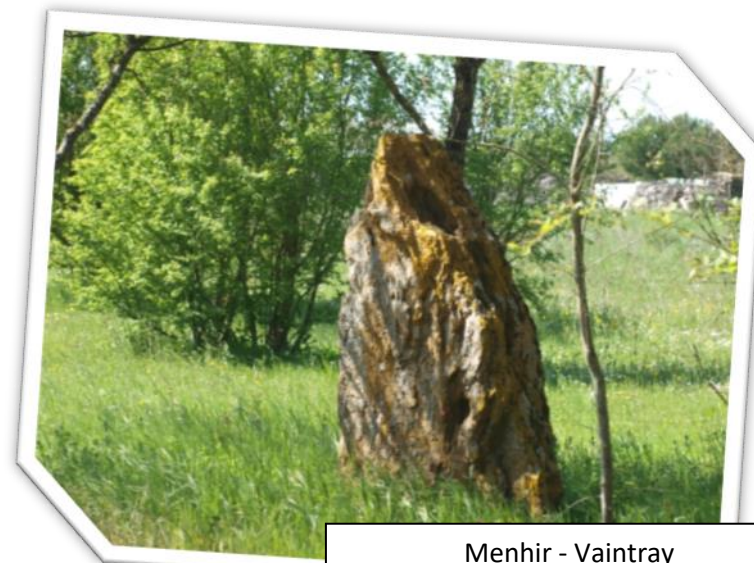
Menhir - Vaintray