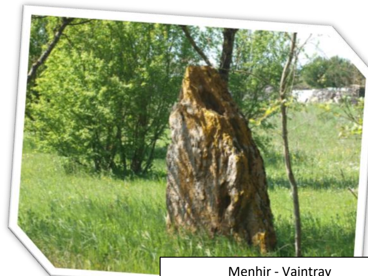
Menhir - Vaintray