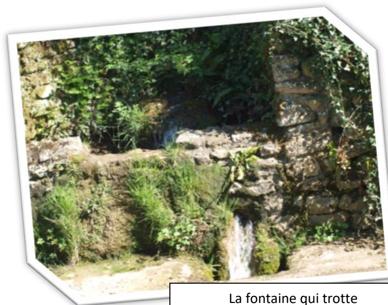
La fontaine qui trotte